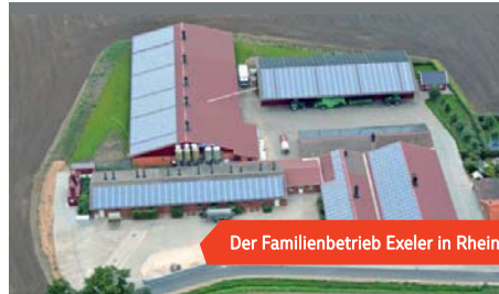
Der Familienbetrieb Exeler in Rheine

Der Transport zwischen verschiedenen Ackerbauregionen und auch die Logistik für Biogasanlagen haben trotz Mautgebühren, strengerer Gesetze und gestiegener Energiekosten weiter zugenommen. So auch bei uns. Vor allem der einseitige Transport von flüssigen Gütern wie Gülle stellte den Betrieb Exeler in der Vergangenheit immer wieder vor Herausforderungen, da dieser mit zeitintensiven und teuren Leerfahrten verbunden war.